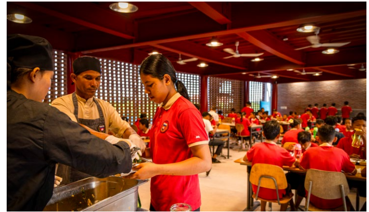
Immer gut besucht: die Schulmensa.

Weitere Klassenräume und alle Fachräume, wie zum Beispiel das Science-Lab, ein neues Computer-Lab oder auch eine Erweiterung unserer Bibliothek sind zurzeit noch im Bau. Gleiches gilt für das Auditorium, das Kunstatelier, die Töpferei, diverse Aufbewahrungsräume sowie eine kleinere Küche, in der die Essen für die Kinder und Lehrkräfte zwar nicht gekocht, sehr wohl aber vorbereitet werden sollen.