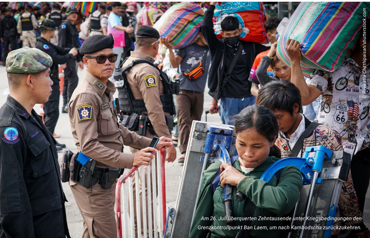
Am 26. Juli überquerten Zehntausende unter Kriegsbedingungen den Grenzkontrollpunkt Ban Laem, um nach Kambodscha zurückzukehren.