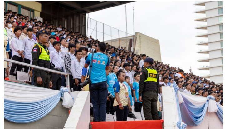
Das Nationalstadion fasst 50'000 Zuschauende.

Für uns als Organisation zählt bei Anlässen wie diesem vor allem die Publicity. Wenn eine kleinere Schule aus der Provinz den Vorzug vor den etablierten Privatschulen aus der Hauptstadt erhält, ist das natürlich die beste Werbung für uns. Und wenn unter den anwesenden Honoratorinnen und Honoratioren dann auch noch der stellvertretende Premierminister Hun Many ist: umso besser. Letzterer zeigte sich schwer angetan von unserem Chor und beglückwünschte unsere Kinder persönlich. Welche Ehre.