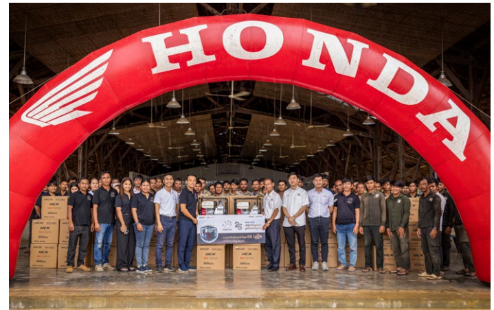
Die Honda-Delegation brachte zu ihrem Besuch 56 Wasserpumpen mit.

Gründe sind neben dem Grenzkonflikt, die schwächere Weltkonjunktur sowie eine Verlagerung der Nachfrage zu stärker beworbenen Zielen wie Vietnam oder Thailand. Ein deutlicher Indikator für die schwache Gesamtnachfrage ist der Rückgang der Besucherzahlen im Angkor-Archäologiepark, der 2024 und in den ersten Monaten 2025 deutlich weniger Gäste verzeichnete als vor der Pandemie. Da Angkor Wat für viele Reisende den Hauptanreiz für eine Kambodscha-Reise darstellt, spiegelt dieser Rückgang das nachlassende internationale Interesse besonders klar wider.