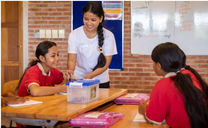
Hier macht das Lernen Spass.

Umso mehr freuen wir uns, dass wir rechtzeitig zum Start des neuen Schuljahrs im August den ersten Bauabschnitt des neuen Schulgebäudes eröffnen konnten. Unter anderem sind bereits die ersten sechs Klassenzimmer fertig. Dann die Büros für die Lehrkräfte, sanitäre Einrichtungen sowie die Schulmensa mit einer Kapazität für bis zu 250 hungrige Mäuler.