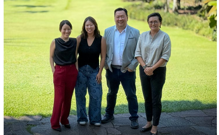
Unser Team in Singapur.

Neben der Professionalisierung unseres Produktangebots sind wir auch als Organisation umtriebiger. Zurzeit sind wir zum Beispiel dabei, eine Landesorganisation in Grossbritannien aufzubauen. Die Bemühungen stecken hier allerdings noch in den Kinderschuhen. Einen deutlichen Schritt weiter sind wir in Singapur. Hier haben wir in diesem Jahr Smiling Gecko Singapore gegründet. Nach der Schweiz, Deutschland, den USA und natürlich Kambodscha ist dies unsere fünfte Niederlassung, wenn uns dieser Begriff gestattet ist. Im Gegensatz zu den anderen Standorten sind wir in Singapur noch nicht als gemeinnützig anerkannt. Aber das ist hoffentlich nur noch eine Frage der Zeit. Und das Team vor Ort ist sowieso auch ohne den Status bereits sehr aktiv. Kaum eine Woche vergeht, in der nicht irgendeine Aktion in dem kleinen aber wirtschaftlich sehr potenten Land für unser Projekt in Kambodscha wirbt. Um so einerseits das Farmhouse Resort als Feriendestination zu positionieren und andererseits neue Potentiale für das Fundraising zu erschliessen. Beides ist und bleibt überaus notwendig.