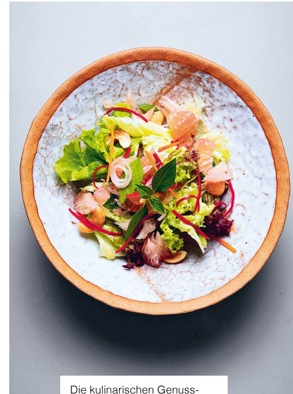
Die kulinarischen Genussmenüs werden im Farmhaus-Restaurant wie im grossen Garten serviert.