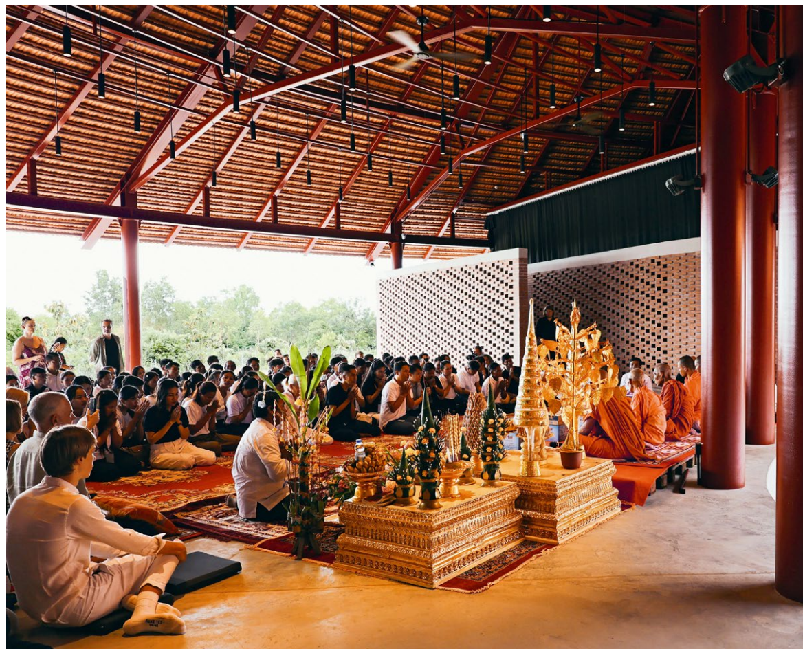
Die Gäste kamen von nah und fern zur grossen Eröffnungszereemonie des Kulturzentrums «The Gong».

Text: Suzanne Schwarz