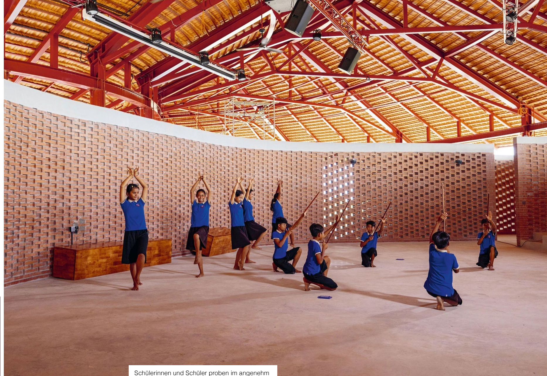
Schülerinnen und Schüler proben im angenehm natürlich klimatisierten Auditorium.