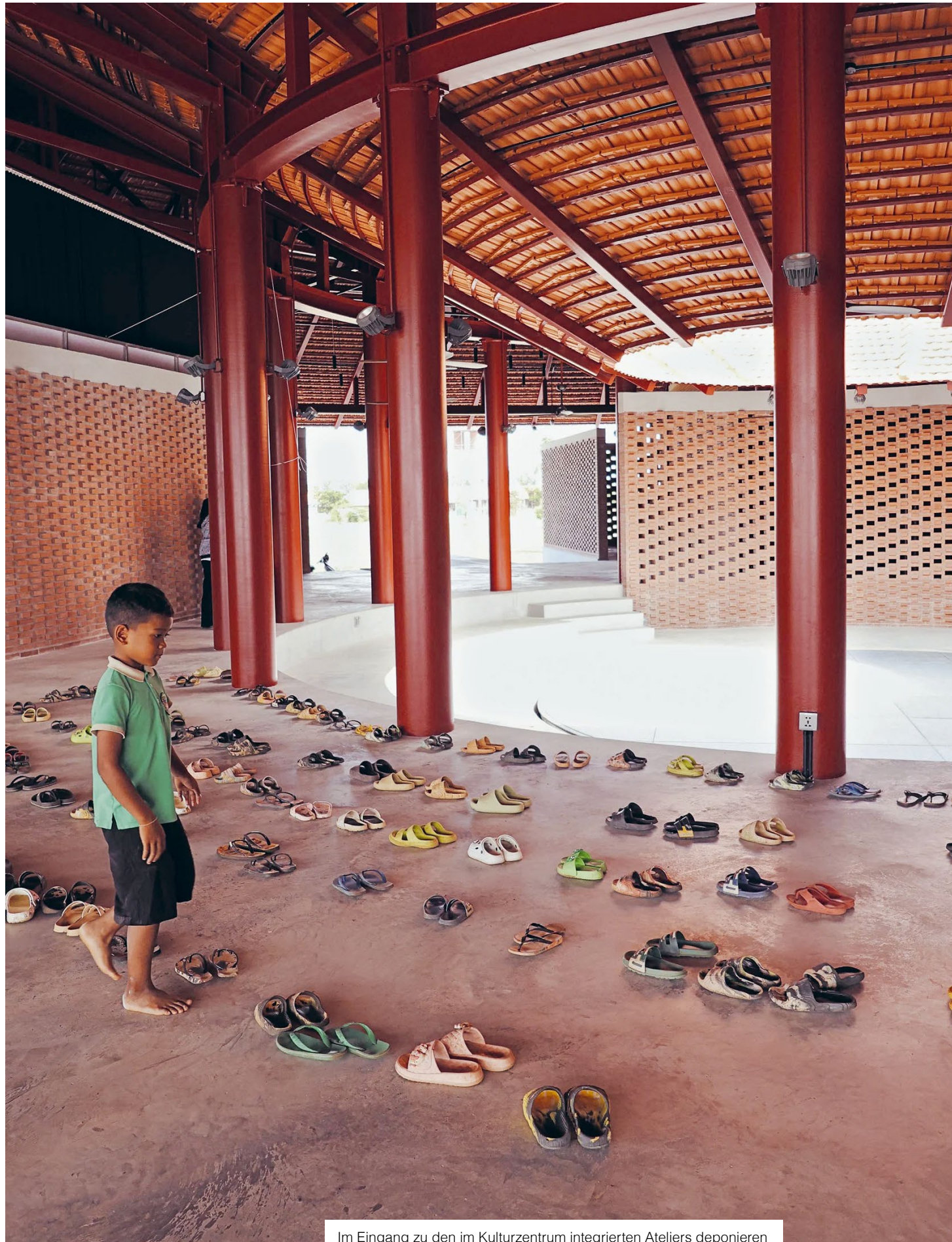
Im Eingang zu den im Kulturzentrum integrierten Ateliers deponieren Studentinnen und Studenten fein säuberlich ihre Schuhe.